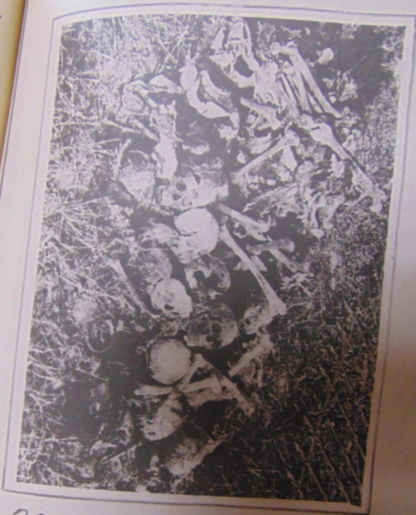
Останки трупов извлеченные из могилы ст. след. ст. 179. К. 15 ст. 116 Сел. Б. 100 кашган Кудуф. ст. след. ст. 179. К. 15 ст. 116 Кашган Кудуф.