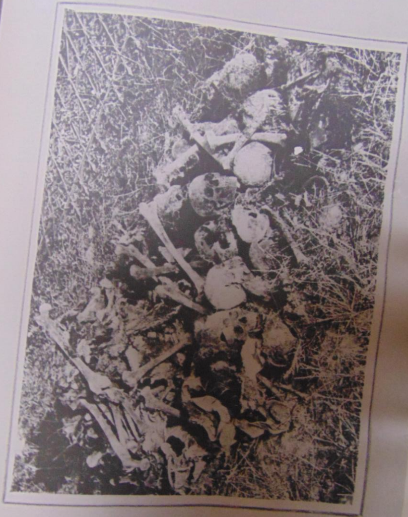
Останки трупов извлеченные из могилы.